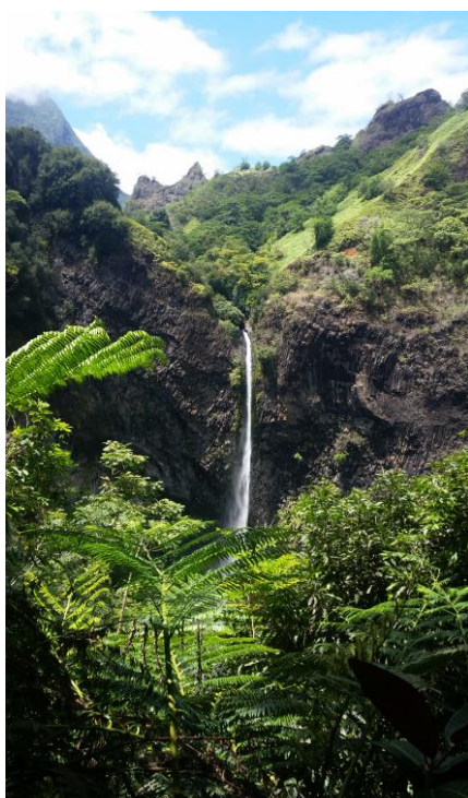
La Fatauà

Cet appel à projet permet aux services du Pays compétent en matière de biodiversité, en s'associant avec une ou plusieurs communes, de réaliser un diagnostic précis de leur territoire pour mieux préserver et valoriser leur patrimoine naturel.